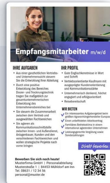
Stellenanzeige mit QR-Code

/ Mit innovativen Tools Jobsuchende erreichen