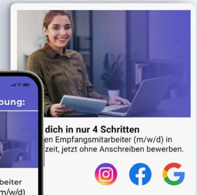
Landingpage mit Quick-Bewerbung, Display Ads auf Social Media / Google